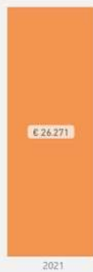
Financiële steun totaal