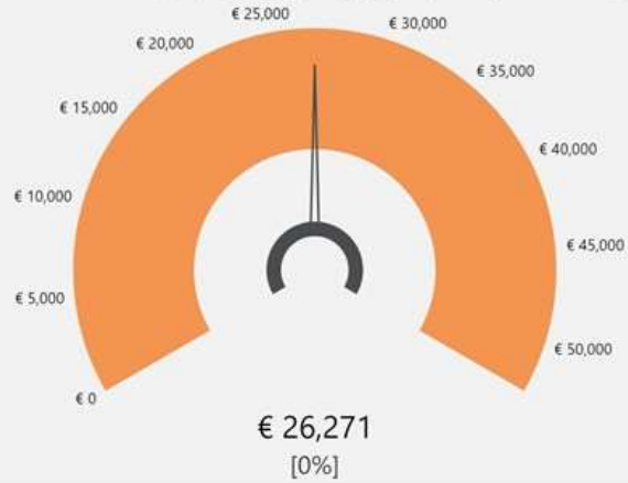
Financiële steun totaal vs ZPVJ